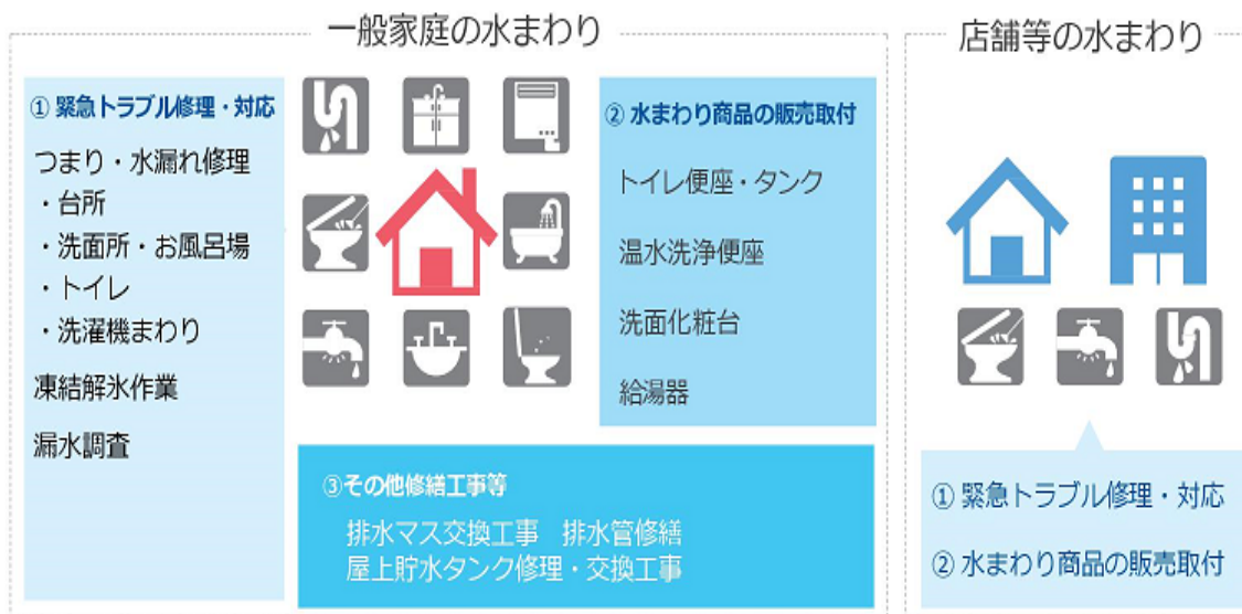
【図表 4】サービスラインナップ

水まわり緊急修理サービス事業のサービス内容は、1) 緊急トラブル修理・対応(トイレ、台所、洗面所、風呂場の水漏れ・つまり)、2) 水まわり製品の販売・取付(温水洗浄便座、洗面化粧台等)、3) その他修繕工事等(排水マス交換工事、排水管修繕等)などで、一般家庭及び店舗等から注文を受けている(図表 4)。